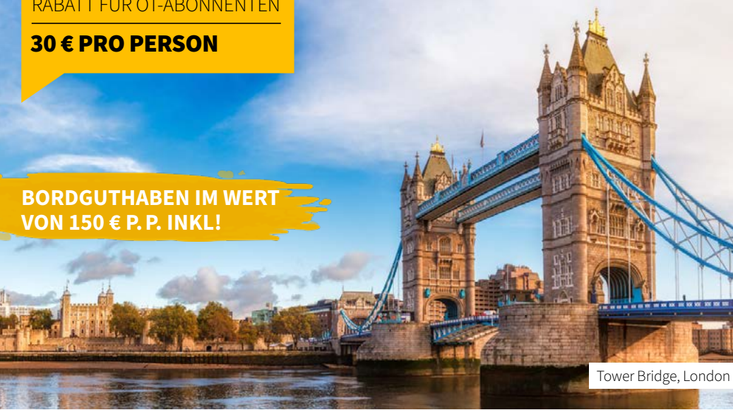
Tower Bridge, London

BORDGUTHABEN IM WERT VON 150 € P. P. INKL!