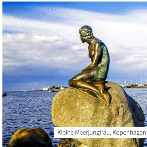
Kleine Meerjungfrau, Kopenhagen

Norwegen ist das Land der Fjorde. Riesige Gletscher formten vor vielen Tausend Jahren diese Unterwassertäler, die sich längst zu salzigen Meeresarmen entwickelt haben. Diese achttägige Kreuzfahrt führt Sie von Kiel über das dänische Kopenhagen tief hinein in den Hardangerfjord und den Gandsfjord. Spektakuläre Wasserfälle und atemberaubende Wanderwege erwarten Sie hier, außerdem tauchen Sie ein in die typisch norwegische Lebensweise! In der UNESCO-Welterbe-Stadt Bergen haben Sie dann genug Zeit, das Erlebte und Gesehene sacken zu lassen – zum Beispiel im historischen Viertel Bryggen mit seinen charmanten Holzhäusern.